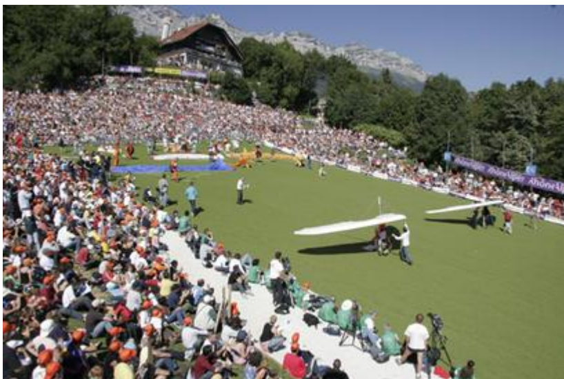
IL ETAIT UNE FOIS LA COUPE ICARE